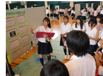
[ポスターセッションに聞き入る1年生たち]